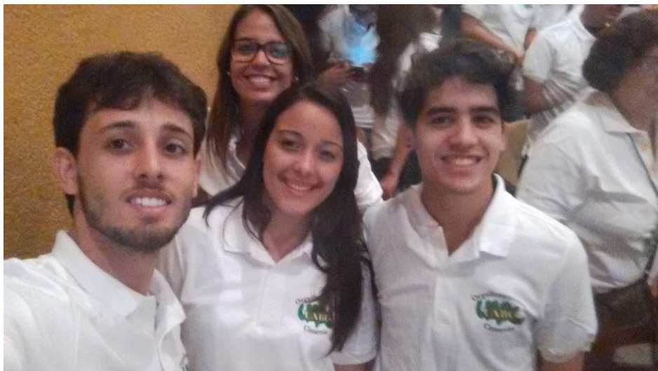
Alunos do IFSULDEMINAS – campus Muzambinho de intercambio na UABC Mexicali

Agradeço ao IFSULDEMINAS pela oportunidade do intercâmbio e a todos do campus Muzambinho que me ajudaram a realizar o mesmo. Obrigada pela oportunidade inesquecível.